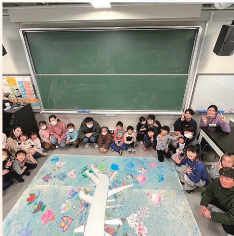
色あそび「大きな木を作ってタネをまこう」