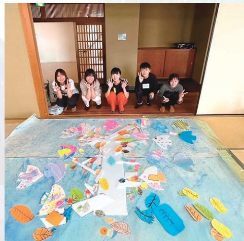
完成が近づいてきた大きな木