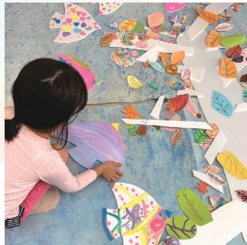
入院中の子どもたちが色付けた背景に作品を載せる