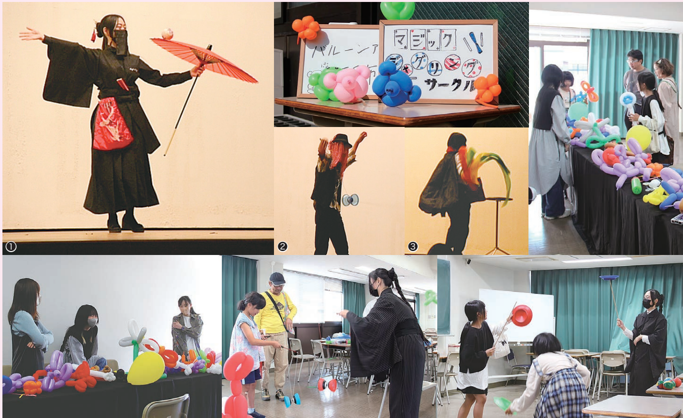
① 傘回しの演技 ② 中国ゴマの演技 ③ ステージマジック