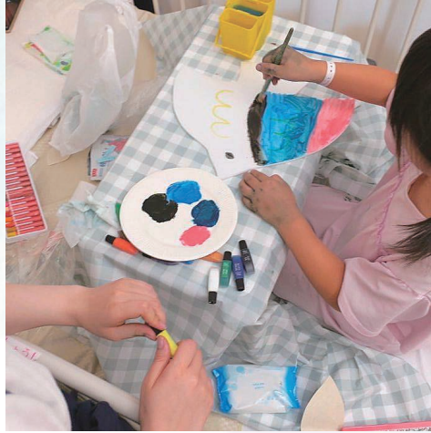
病室で作品づくりに取り組む子ども