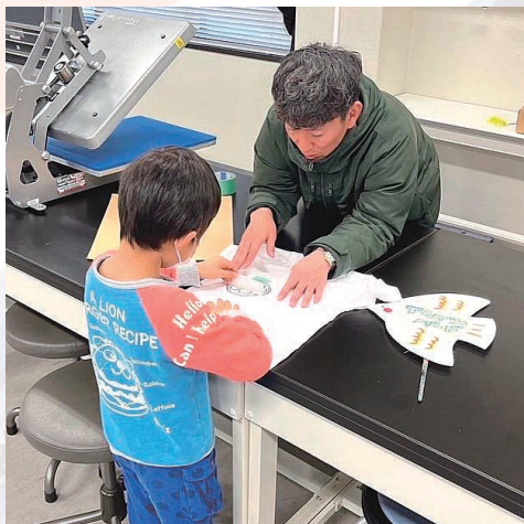
Tシャツプリント体験会